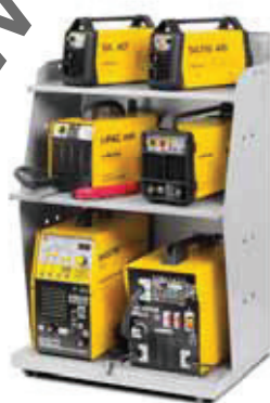
019004 Displayer Concept 66 x 47 x 102 cm 3 ripiani - 3 shelves