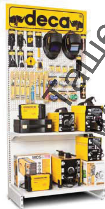
019001 Blister Display Concept 100 x 50 x 201,5 cm